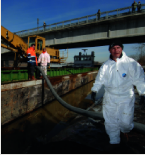
Mitarbeiter des italienischen Zivilschutzes während der Umweltkatastrophe: Mit Sperren und Bindemitteln versuchte man das Öl aufzuhalten und abzusaugen.

Mit der illegalen Giftmüllentsorgung verdient die Mafia heute mehr Geld als im Drogenhandel.